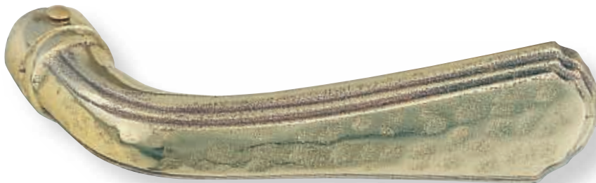
BE 277 martelée L 115 mm