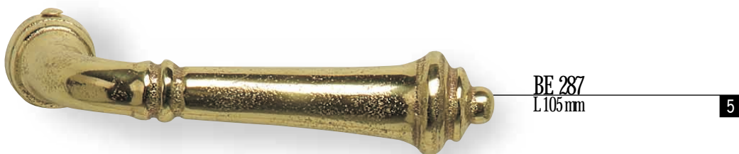
BE 287 L.105mm 5