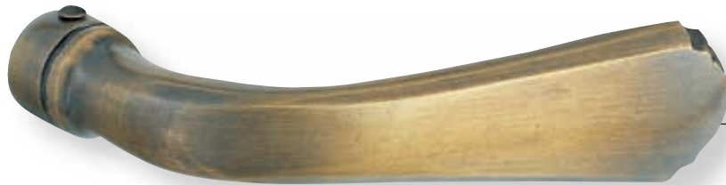
BE 277 ter lisse L 105 mm