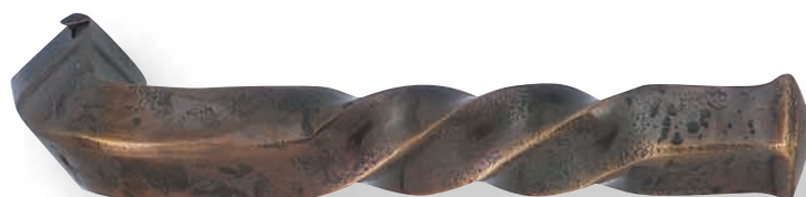
BE 267 bis L.130mm