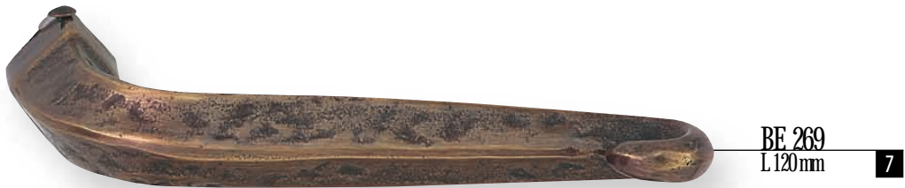
BE 269 L 120 mm 7