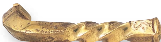
BE 267 L.110mm