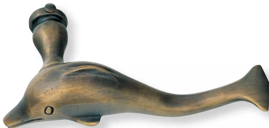
BE 281 L.125mm