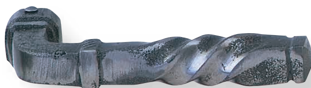
BE 251 L.110mm