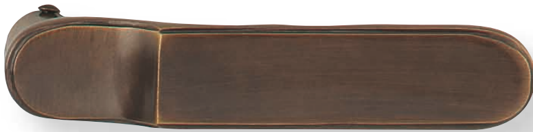
BE 291 bis L112mm