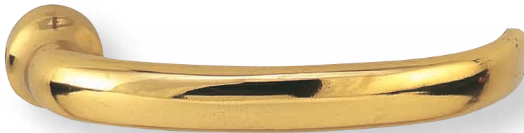
BE 293 L110mm