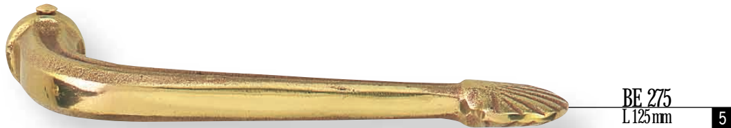
BE 275 L 125 mm 5