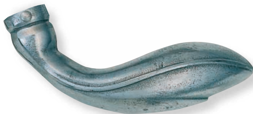
BE 263 L.100mm