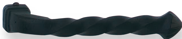
BE 259 L.110mm