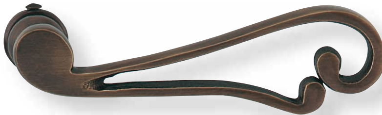
BE 265 L.110mm 7