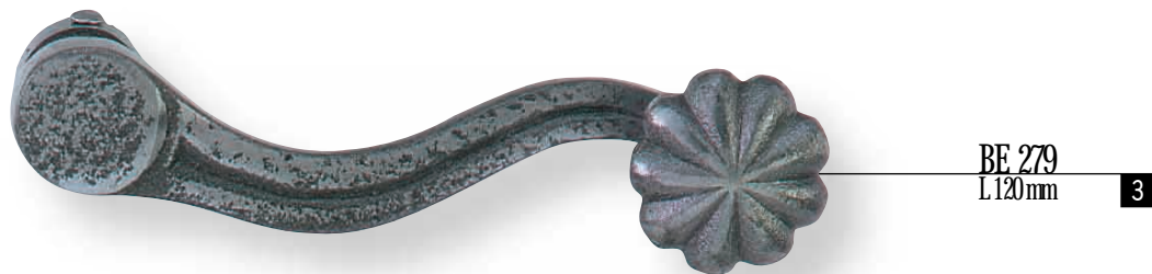
BE 279 L 120 mm 3