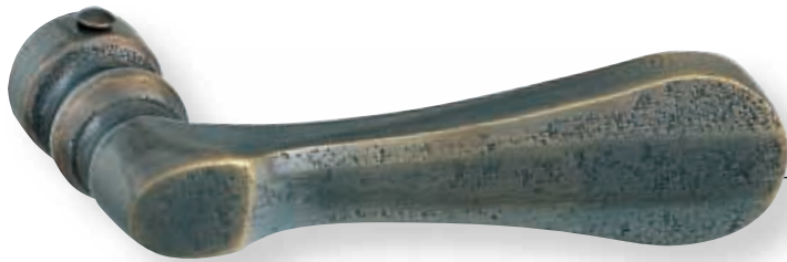
BE 289 martelée L 85 mm