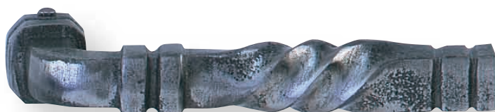
BE 1214 L.125mm