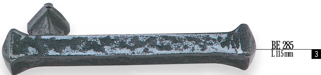
BE 285 L 115 mm 3