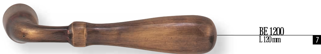
BE 1200 L.120mm 7