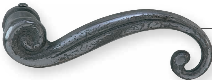
BE 261 L.100mm 3