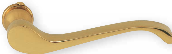
BE 1202 L.95mm 5