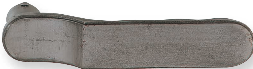
BE 291 L135mm