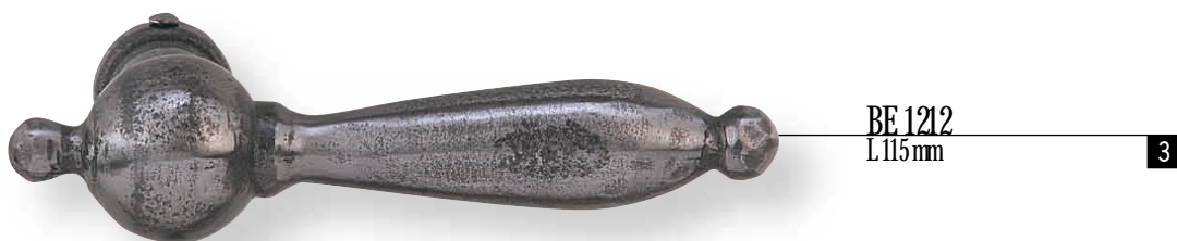
BE 1212 L.115mm 3