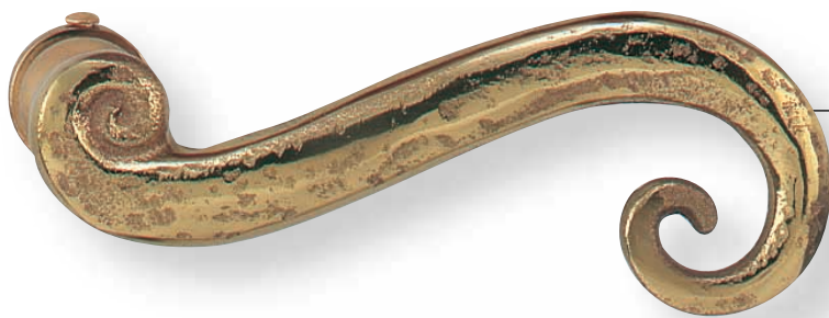
BE 271 L.100mm 5