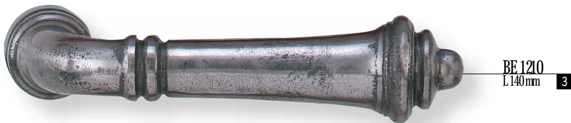
BE 1210 L.140mm 3