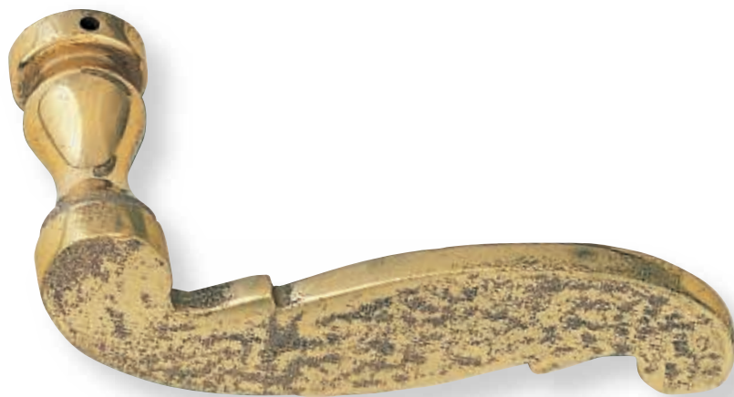
BE 255 bis L.100mm